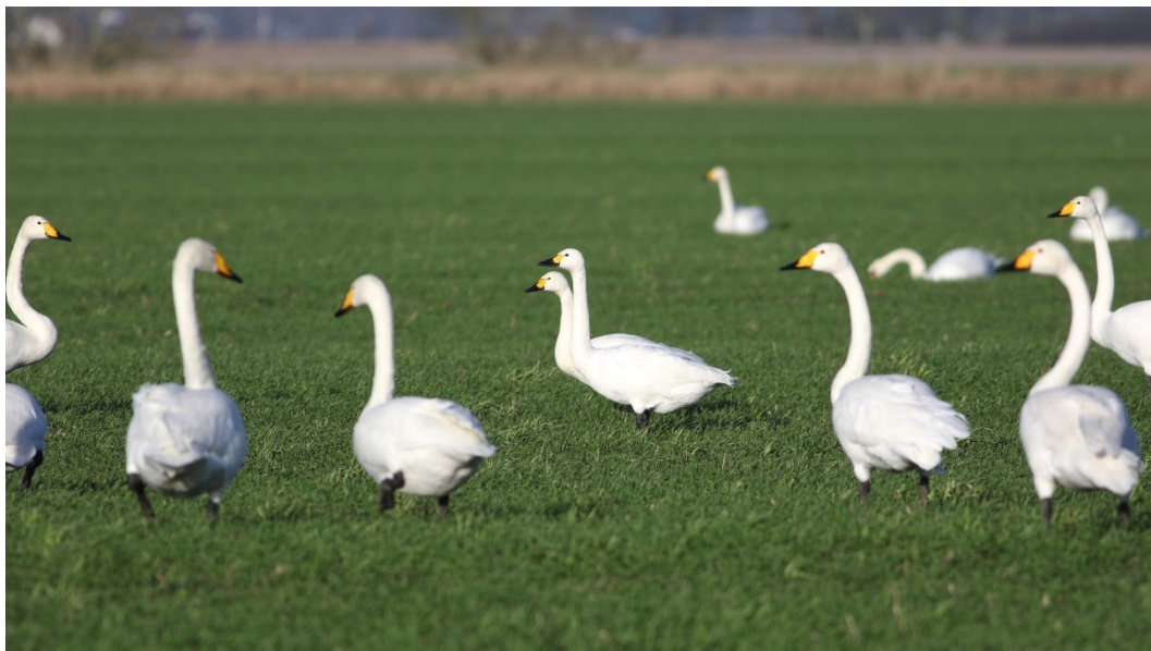
Pibesvaner mellem sang- og knopsvaner ved Hollandsbjerg Holme nær Randers Fjord.

Aktuelt er der en øget bevågenhed på status for pibesvane , fordi arten er i tilbagegang i Vesteuropa og bl.a. derfor er genstand for en international forvaltningsplan under AEWA (Vandfugleaftalen). Vi indsamler i den forbindelse data for at understøtte forvaltningsplanen – og skal opfordre alle der ser pibesvaner til at registrere habitatvalg og alder (antal adulte og juvenile, hvis muligt kuldstørrelser) på fuglene. Begge dele kan indtastes på fugledata.dk . Kuldstørrelser indtastes i kommentarfeltet som 1,1,2,2,3,4,5 eller 2x2, 2x2, 1x3 osv.